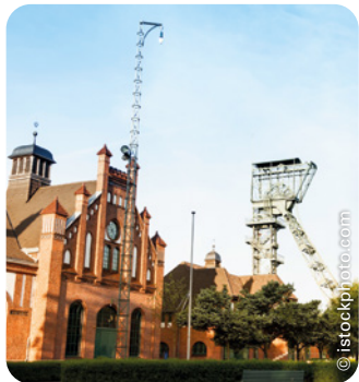
Zeche Zollern in Dortmund

Montag bis Freitag von 9:00–16:00 Uhr Einfach und unbürokratisch!