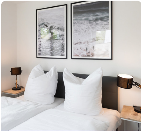
Die modernen und hellen Apartments zeichnen sich durch ihre geschmackvolle und hochwertige Einrichtung aus.

Mehr über unser Ferienhaus-Angebot erfahren Sie auf unserer Website www.blindenfreunde.de im Bereich „Angebote“. Oder Sie rufen uns an: Tel. (030) 8234328. Wir freuen uns auf Sie!