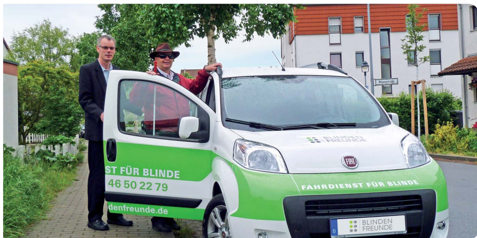
Der Fahrdienst kostet im Jahr 12.000 Euro pro Blindenmobil. Jede Spende zählt!

In Berlin, Köln, Hannover, Hamburg und dem Rhein-Main-Raum fahren sie schon: Die Blindenmobile verhelfen dort vielen blinden und schwerst sehbehinderten Menschen zu mehr Unabhängigkeit. Doch der Service – Auto, Benzin, Fahrer – kostet viel Geld. Über 70.000 Euro haben wir allein in 2012 für den Fahrdienst ausgegeben. Da wir jedoch immer wieder bestätigt bekommen, wie wichtig die Blindenmobile für die Betroffenen sind, um ihren Alltag selbstbestimmt zu meistern, liegt es uns