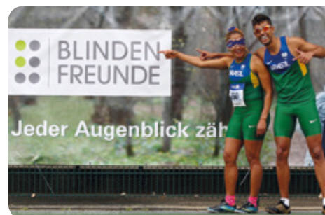
Moderne Werbung: Das Blindenfreunde-Banner

vorbildliche Nachwuchsarbeit mit sehbehinderten und blinden Jugendlichen.