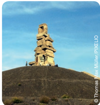
Himmelsleiter in Gelsenkirchen

Montag bis Freitag von 9:00–16:00 Uhr Einfach und unbürokratisch!