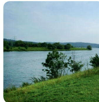
Kemnader See in Bochum