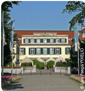
Schloss Berge in Gelsenkirchen