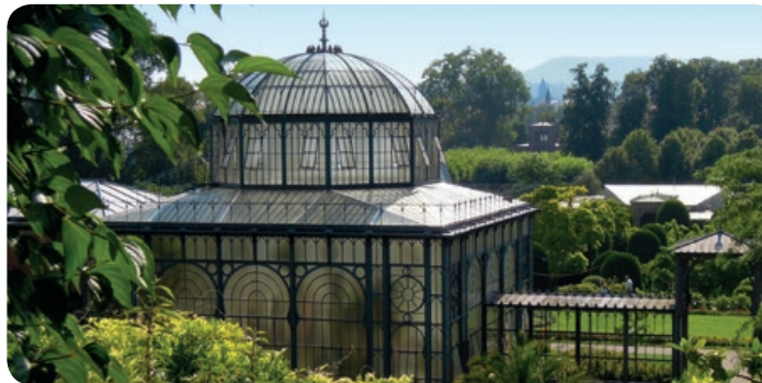
Wilhelma, hist. Schlossanlage und zoologisch-botanischer Garten