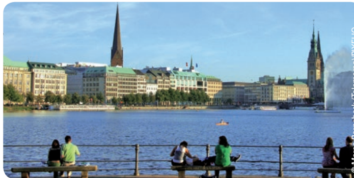
Binnenalster und Jungfernstieg