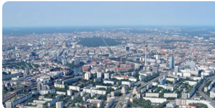
Blick über die Hauptstadt

Montag bis Freitag von 9:00–16:00 Uhr Einfach und unbürokratisch!