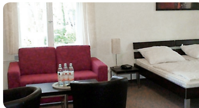
Die Familiensuite ist komfortabel und zeitgemäß eingerichtet.