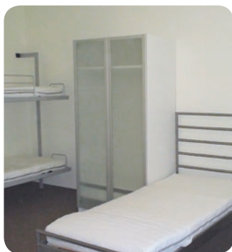
Zweckmäßig und funktional: das Doppelzimmer ohne Bad.