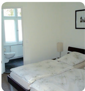
Hell und freundlich präsentiert sich das Doppelzimmer mit Bad.