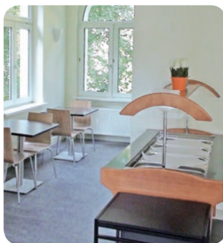
Der Frühstücks- bzw. Aufenthaltsraum lädt zum Verweilen ein.