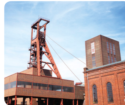
Zeche Zollverein in Essen