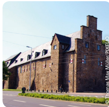
Schloss Broich zu Mülheim