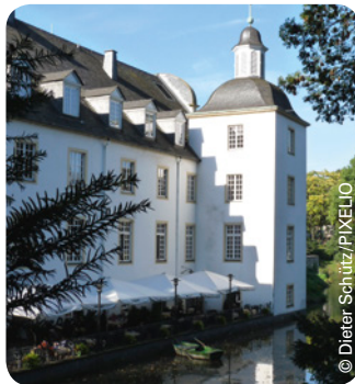
Schloss Borbeck in Essen