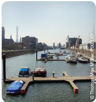
Binnenhafen in Duisburg

Montag bis Freitag von 9:00–16:00 Uhr Einfach und unbürokratisch!