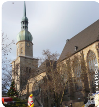
St. Reinoldi-Kirche in Dortmund