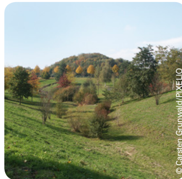
Herbstimpressionen in Lünen