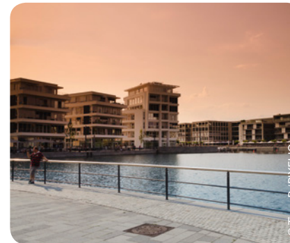
Phoenixsee in Dortmund