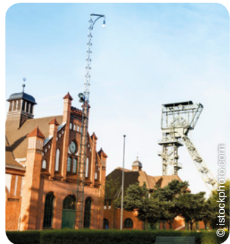
Zeche Zollern in Dortmund

Montag bis Freitag von 9:00–16:00 Uhr Einfach und unbürokratisch!