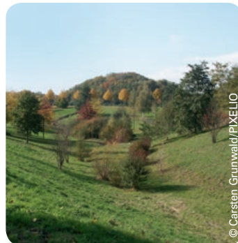
Herbstimpressionen in Lünen