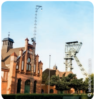
Zeche Zollern in Dortmund

Montag bis Freitag von 9:00–16:00 Uhr Einfach und unbürokratisch!