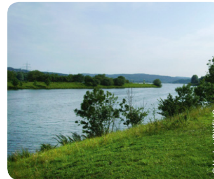
Kemnader See in Bochum