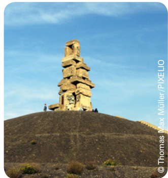
Himmelsleiter in Gelsenkirchen

Montag bis Freitag von 9:00–16:00 Uhr Einfach und unbürokratisch!