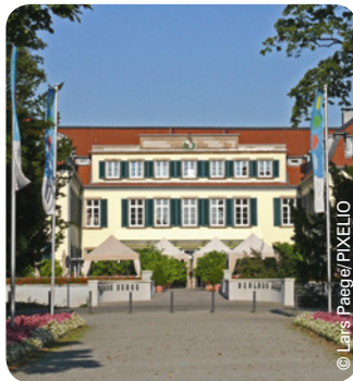
Schloss Berge in Gelsenkirchen