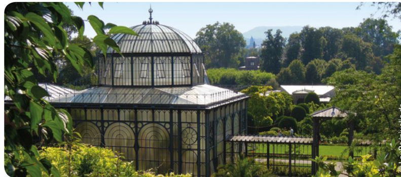
Wilhelma, hist. Schlossanlage und zoologisch-botanischer Garten