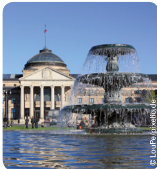
Das Kurhaus in Wiesbaden