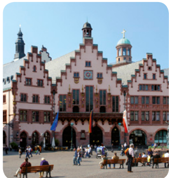
Der Römer in Frankfurt am Main

Montag bis Freitag von 9:00–16:00 Uhr Einfach und unbürokratisch!