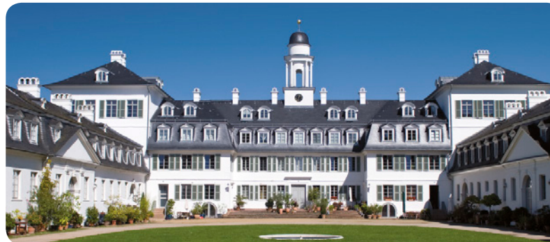
Schloss Rumpenheim in Offenbach