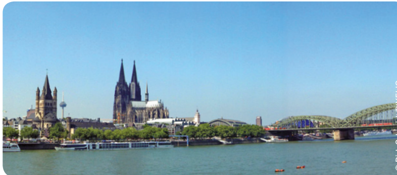
Blick auf den Kölner Dom