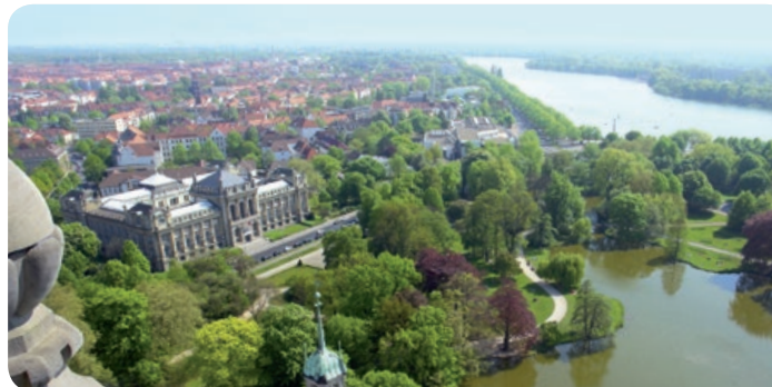
Das Neue Rathaus am Maschsee

Montag bis Freitag von 9:00–16:00 Uhr Einfach und unbürokratisch!