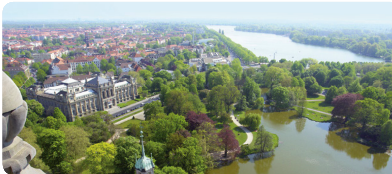
Das Neue Rathaus am Maschsee