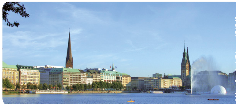
Binnenalster und Jungfernstieg