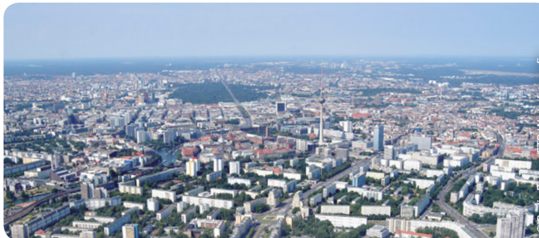
Blick über die Hauptstadt