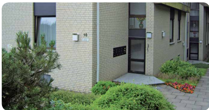
Das gepflegte Appartementhaus ist ruhig und umgeben von Natur.